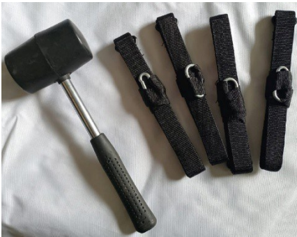
MARTELLO E PICCHETTI