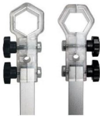
ATTACCHI + BARRE ALLUMINIO